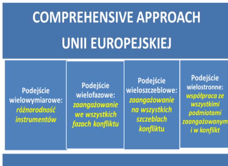
Szkic 3. Comprehensive approach UE

Strategia akcentuje konieczność zintegrowanego, kompleksowego podejścia (comprehensive approach) do konfliktów i kryzysów poprzez wykorzystywanie wszystkich dostępnych instrumentów dla zapobiegania, opanowywania i rozstrzygania konfliktów (szkic 3.).