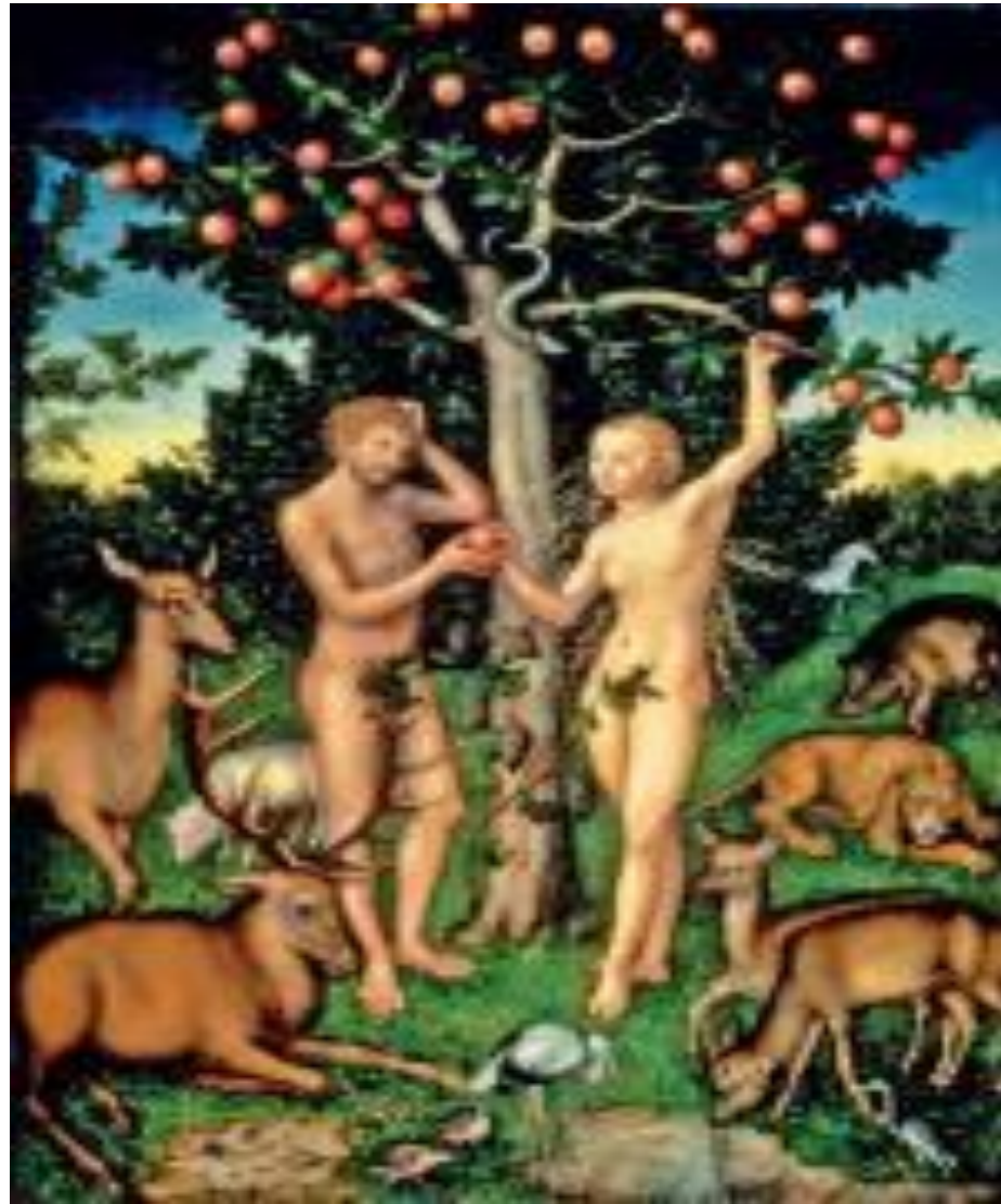
Źródło: Bridgeman Art Library: „Adam i Ewa”, obraz Lucasa Cranacha Starszego, 1526